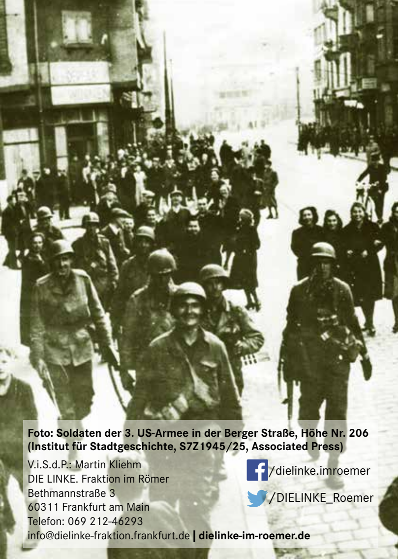
Foto: Soldaten der 3. US-Armee in der Berger Straße, Höhe Nr. 206

V.i.S.d.P.: Martin Kliehm DIE LINKE. Fraktion im Römer Bethmannstraße 3 60311 Frankfurt am Main Telefon: 069 212-46293 info@dielinke-fraktion.frankfurt.de | dielinke-im-roemer.de